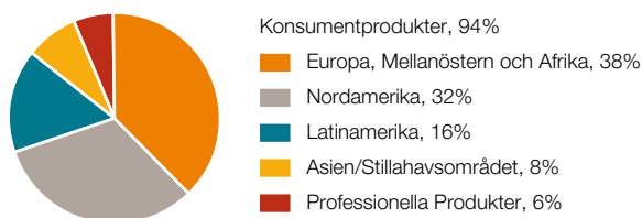
Andel av försäljningen per affärsområde